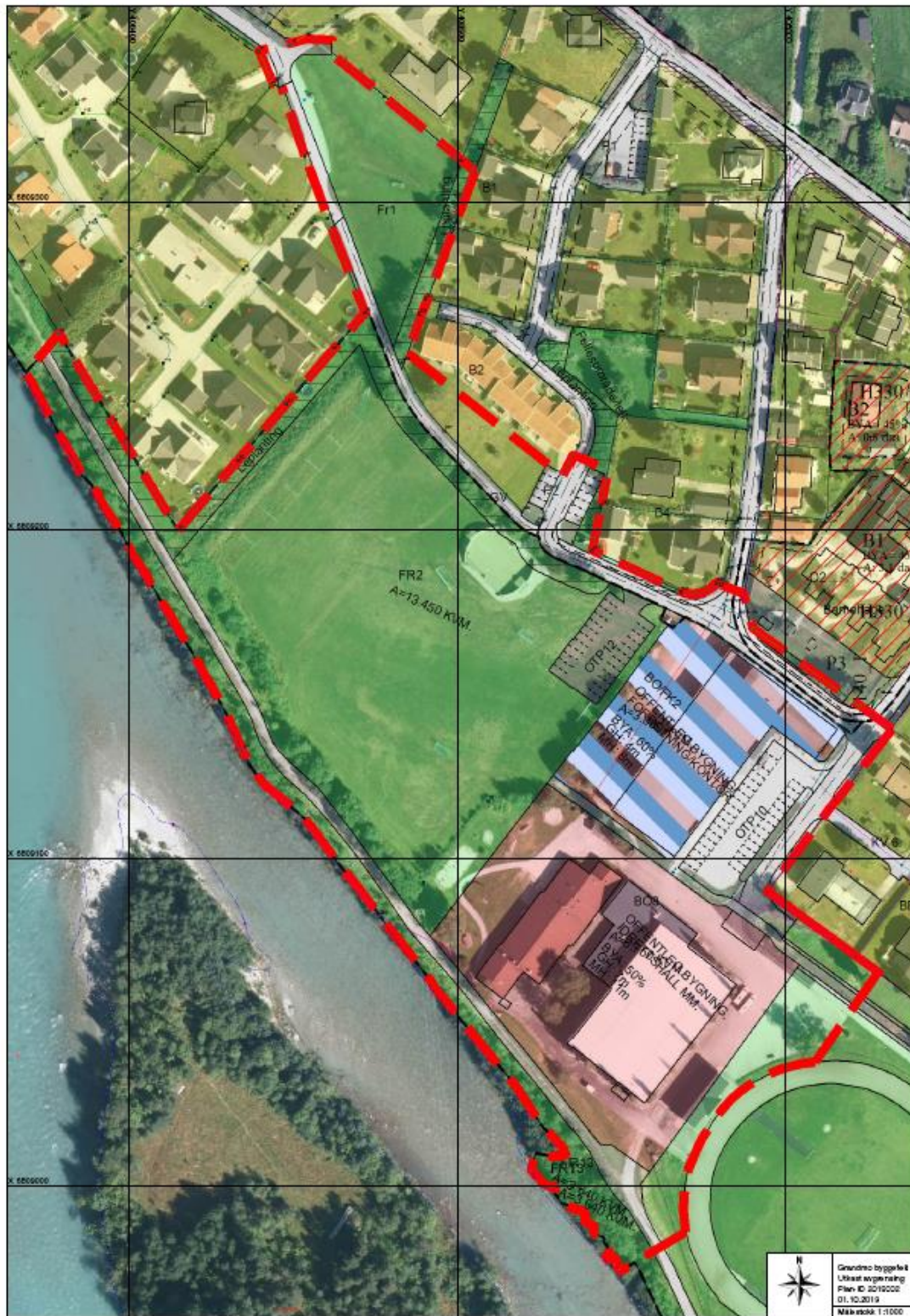
Figur 1.2 Kartskisse som syner plan- og analyseområdet.