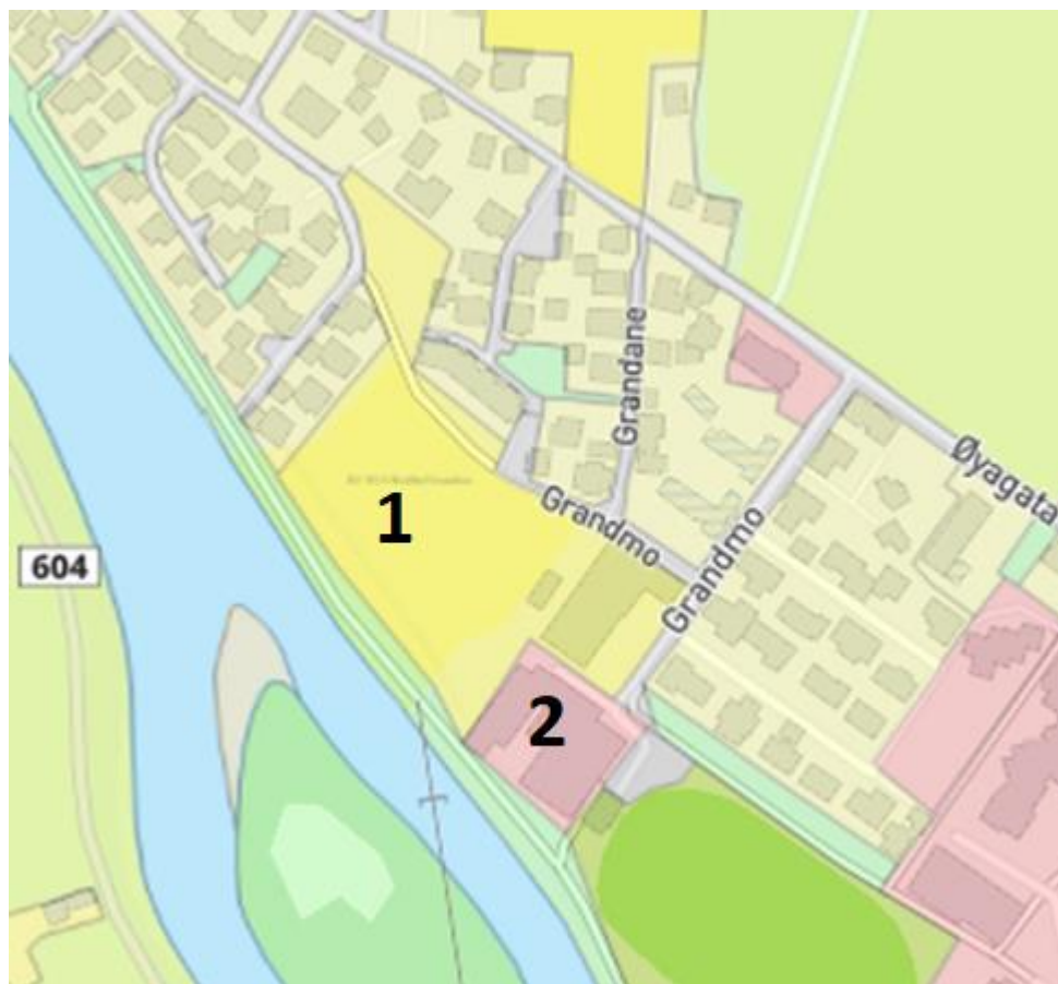
Figur 2 Oversyn over føremål i overordna plan